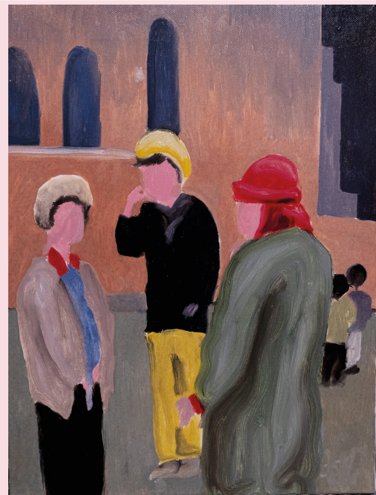
IN PIAZZA 40 x 30 cm OLIO SU TELA 2022