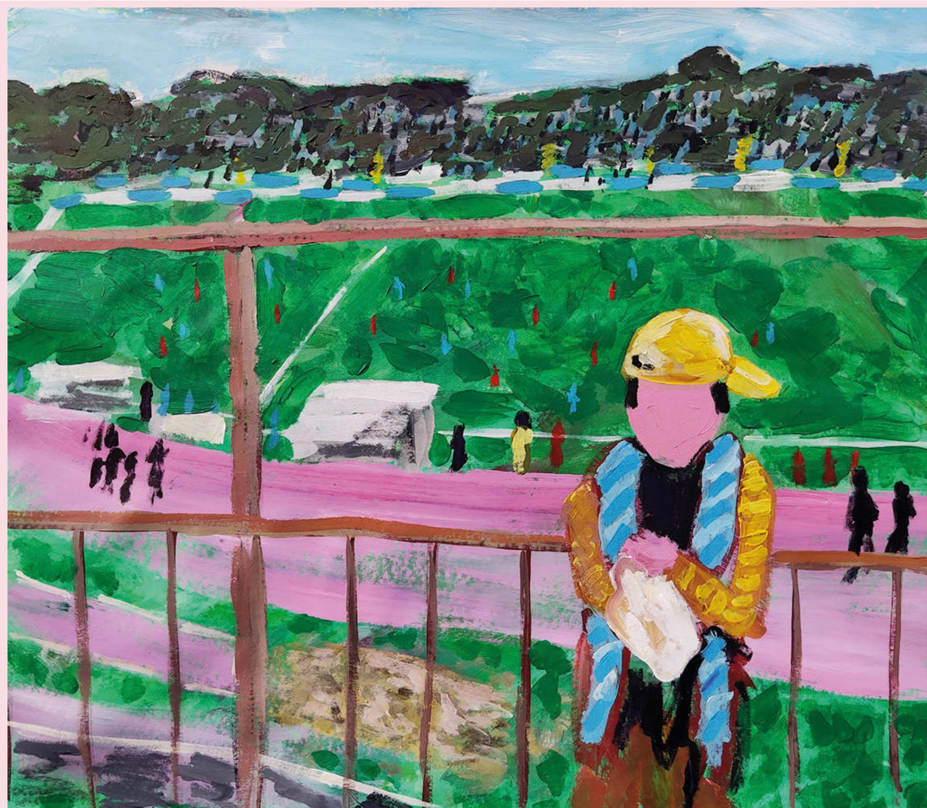
PESCARA - TORINO, STADIO ADRIATICO 85 X 75 CM ACRILICO SU TELA