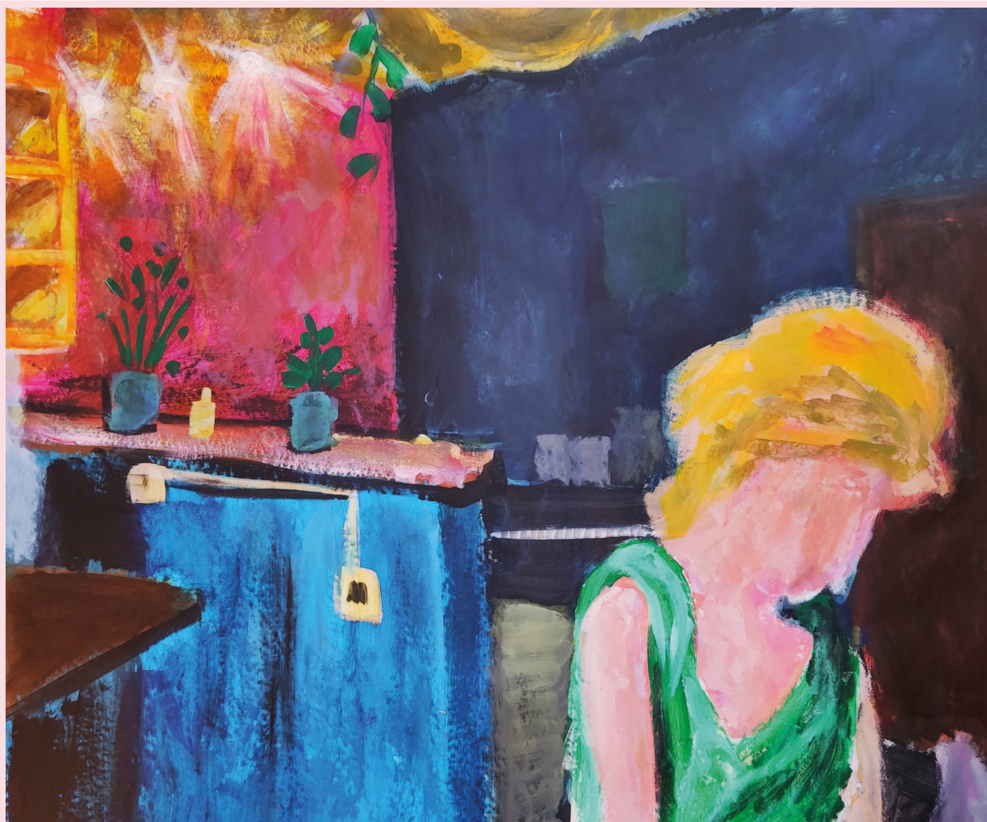
LIVIA IN CUCINA 95 X 75 cm ACQUARO SU TELA 2021