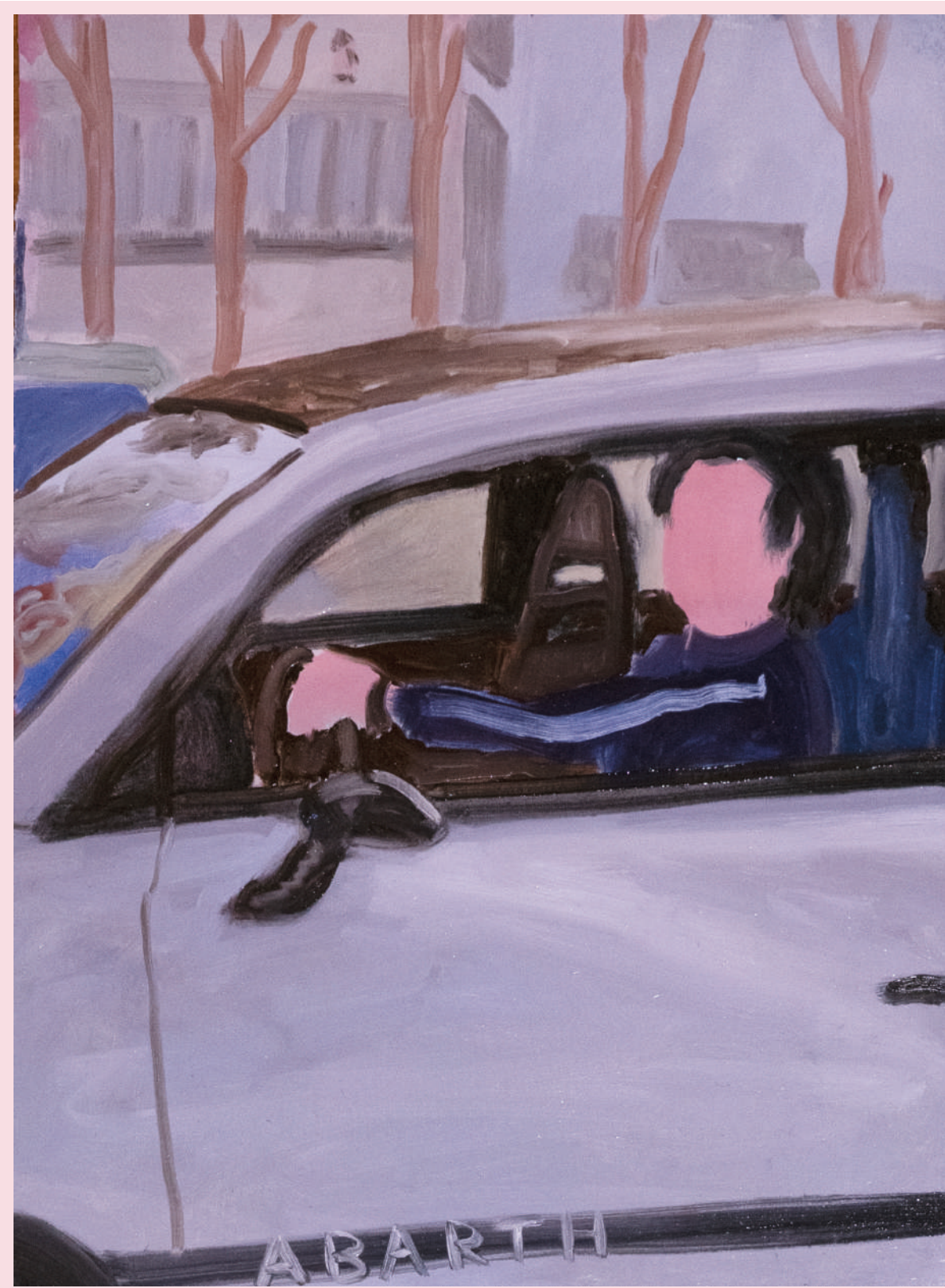
MATTEO NELLA ABARTH 30 x 40 cm OLIO SU TELA 2022