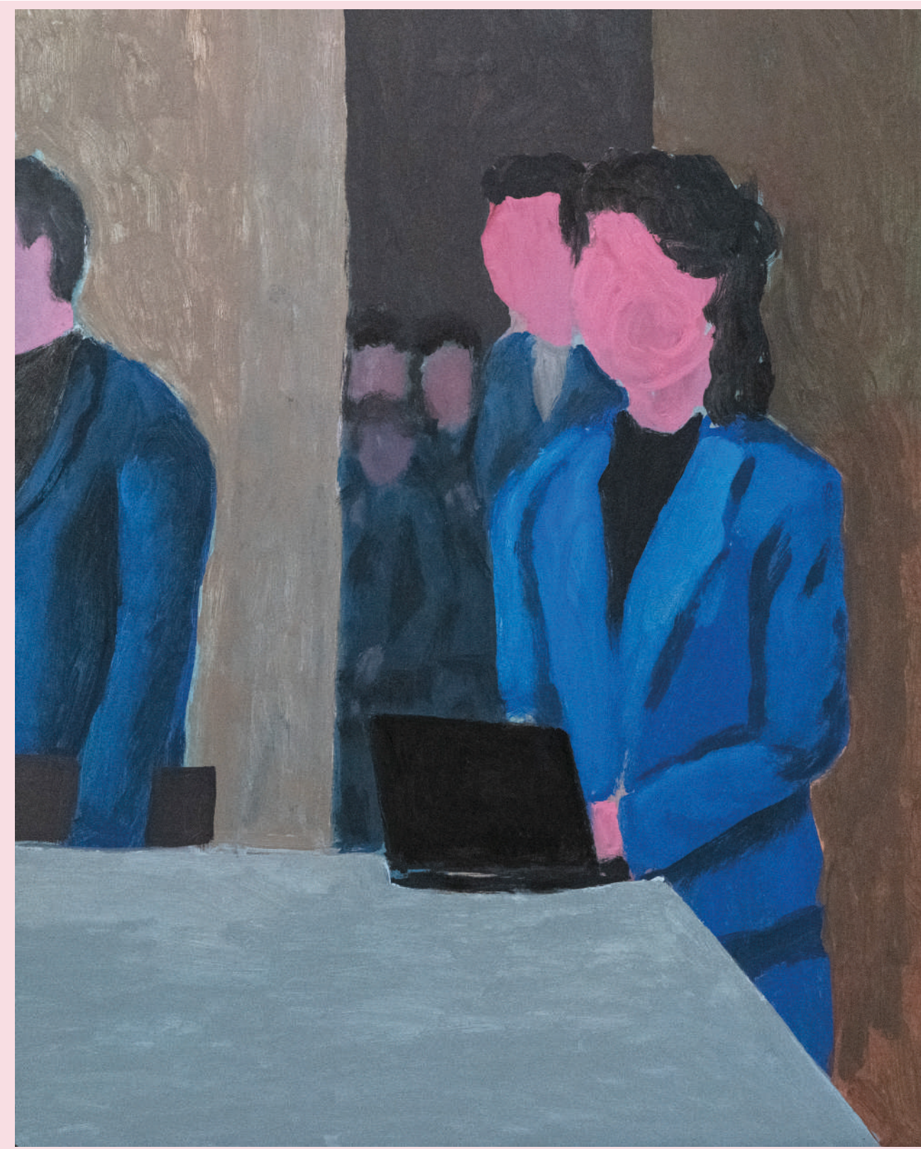
LSDY MARIANNE UDORA AL PARLAMENTO EUROPEO ACRILICO SU MDF 38 X 48 cm 2022