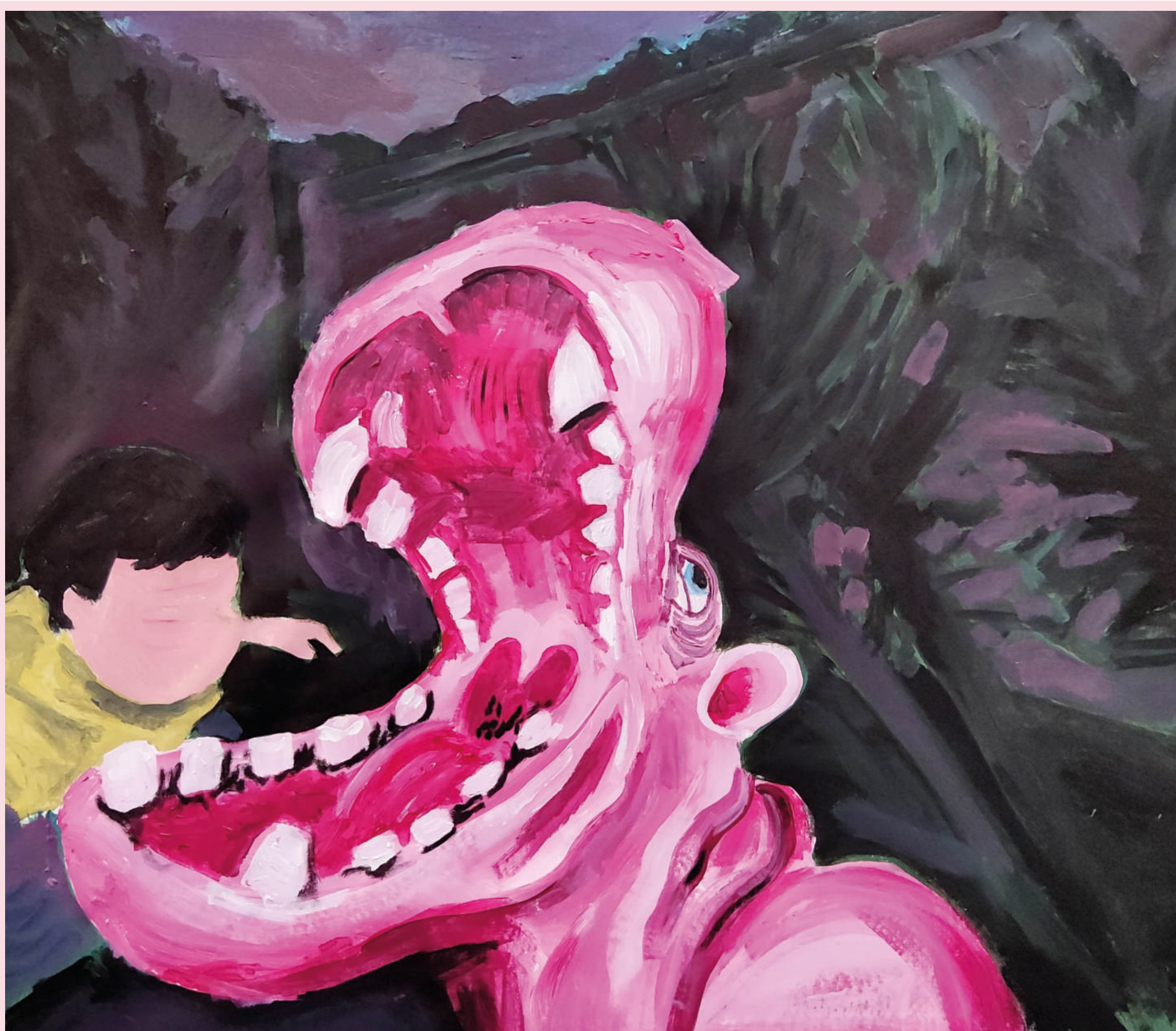
EDÉN LANDI, NASCI 1996 75 x 62 cm ACRÍLICO SU TELA 2020