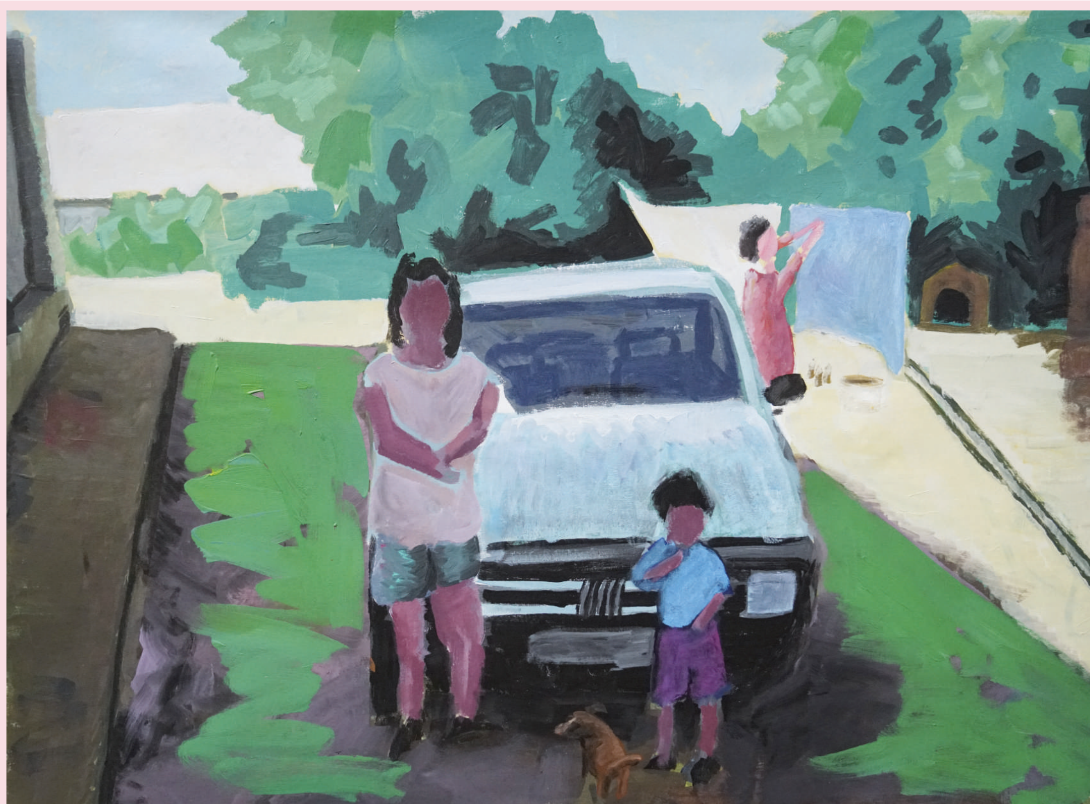
DIETRO CASA 35 X 75 cm ACRILICO SU TELA 2021