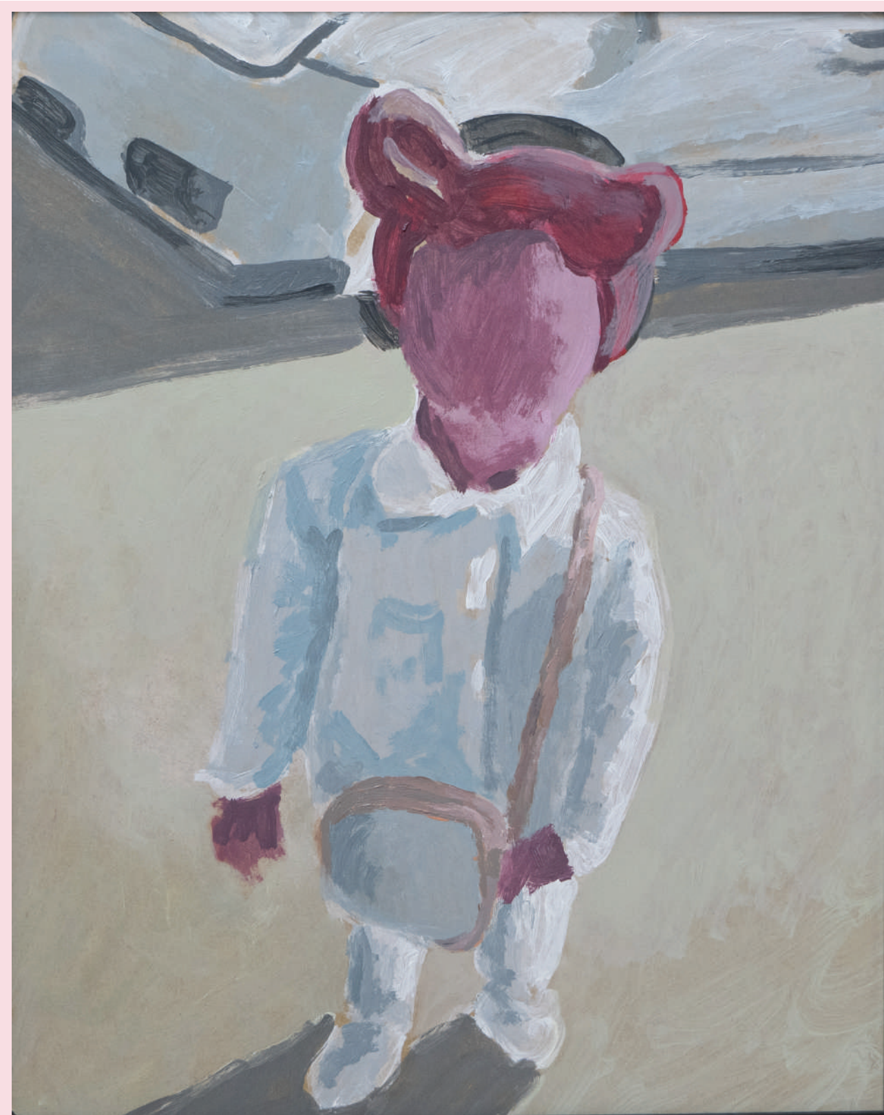
BABY 38 X 48 cm ACRILICO SU MDF 2022