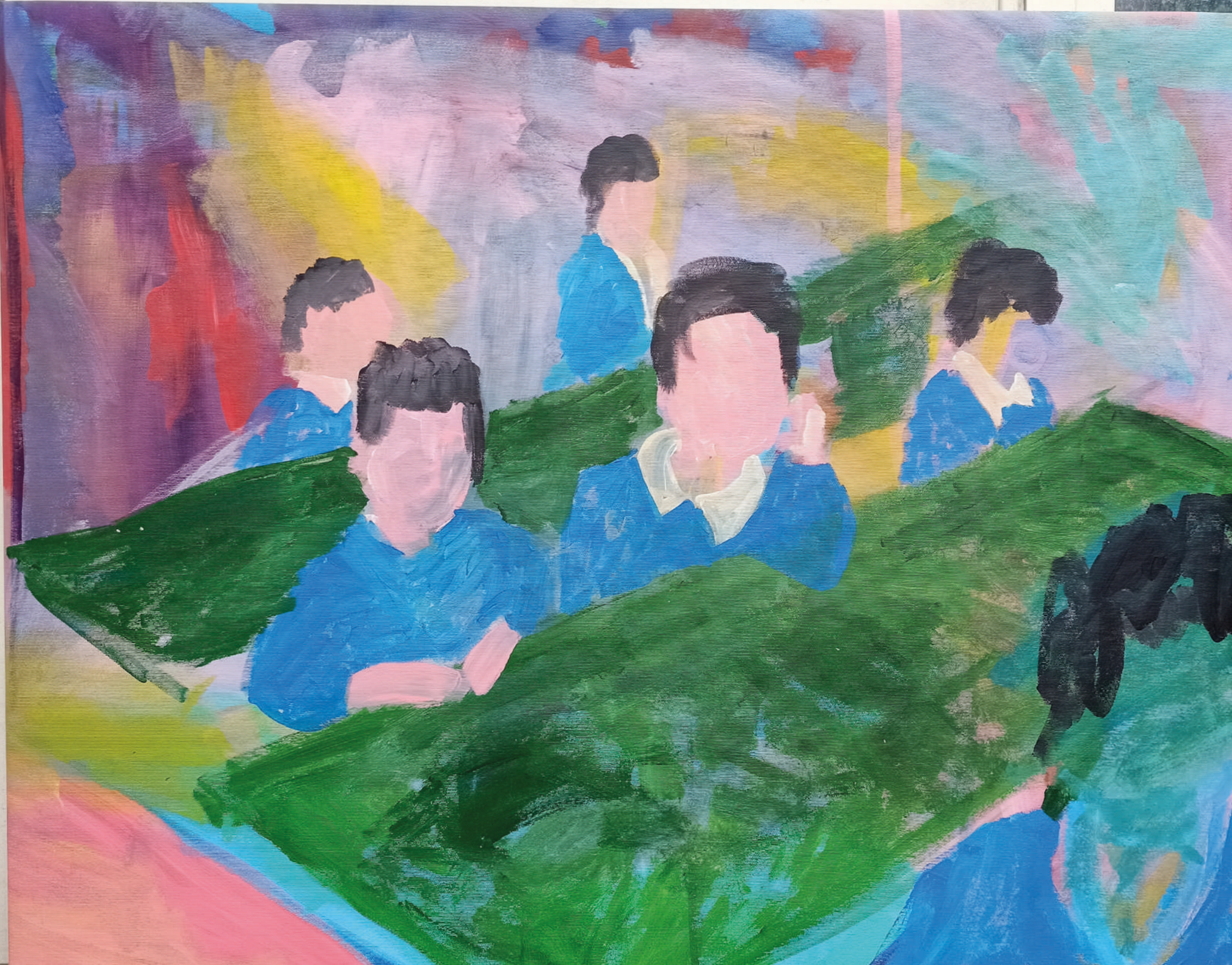
PRIMO GIORNO DI SCUOLA 100 x 80 cm ACRILICO SU TELA 2019