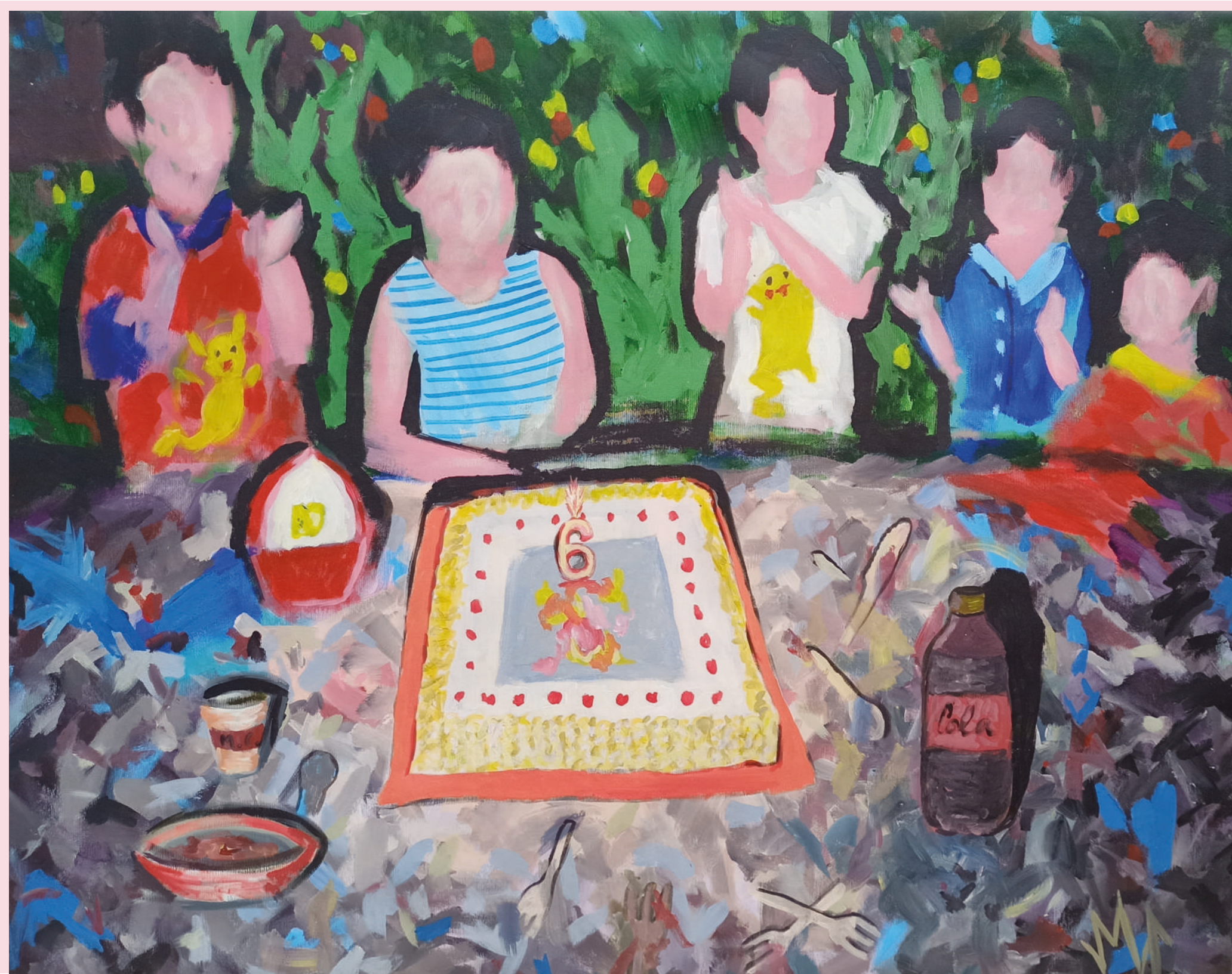
SESTO COMPLEANNO 90 X 115 CM ACRILICO SU TELA 2020