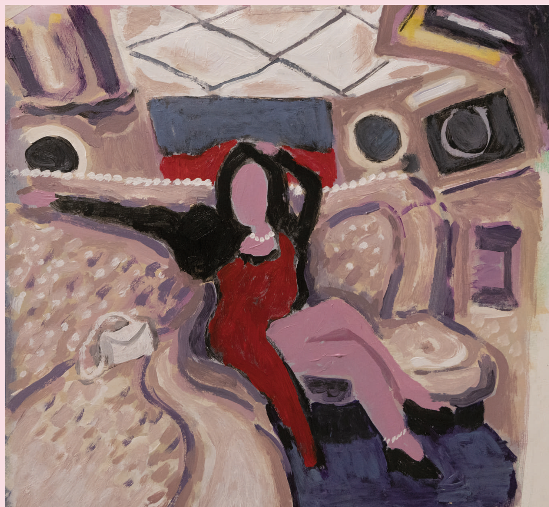
DUE A CELESTINO 25 X 35 cm ACRILICO SU TELA 2022